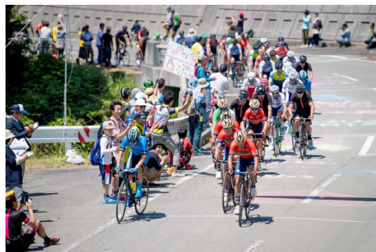
山岳ポイント通過