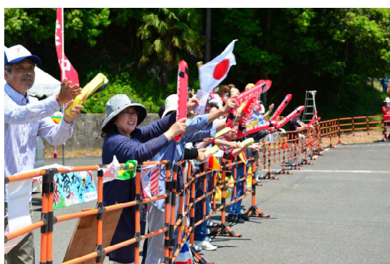
地元応援ブースからの力強い声援