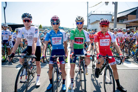
スタート地点 (阿下喜駅)